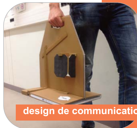
design de communication