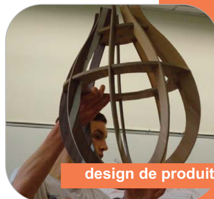
design de produit

Cependant, en fin d'année de seconde, les élèves sont libres de s'orienter vers n'importe quelle filière, générale ou technologique.