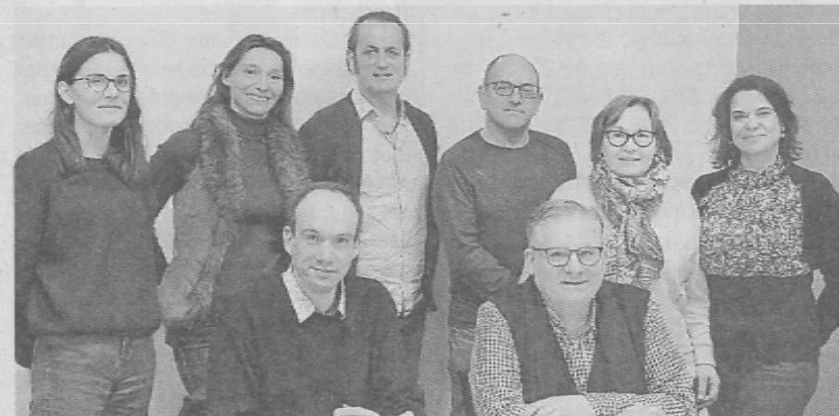
Les enseignants des établissements scolaires des trois pays et les professionnels du monde du théâtre se rencontrent pour développer une feuille de route.

Sur la durée du programme, qui s'étale sur deux années scolaires, 2019-2020 et 2020-2021, les élèves de seconde, qui participent au projet, effectueront des échanges scolaires croisés.