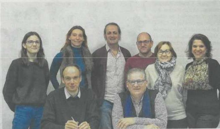
Les six enseignants impliqués dans le projet ont pris contact avec la Houlala

Il s'adresse à tous les élèves de 15 à 18 ans des trois établissements partenaires, avec priorité donnée aux élèves des six enseignants portant le projet. 24 élèves y participeront, 8 de chaque nationa-